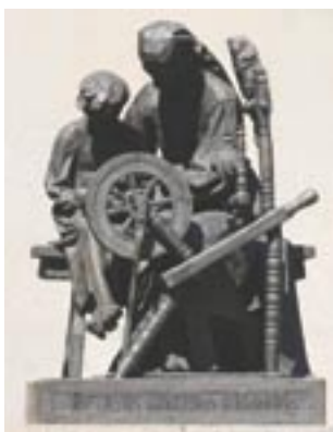
△ „Lietuvos mokykla spaudos draudimo metais“ (skulpt. P. Rimša, 1941)

1940 m. birželį Sovietų Sąjunga okupavo Lietuvą.