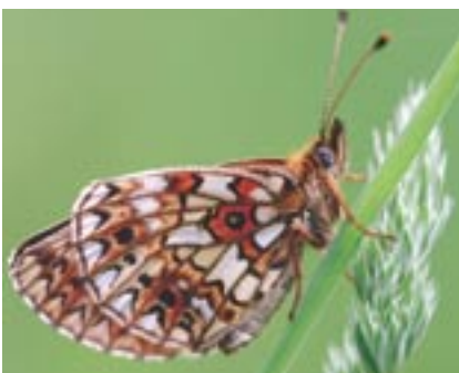
Vidutinė paros temperatūra +17°C. Vidutinis mėnesio kritulių kiekis 80–110 mm