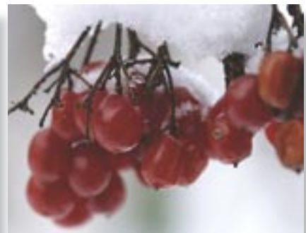
Vidutinė paros temperatūra -3^{\circ}\text{C} . Vidutinis mėnesio kritulių kiekis 30–70 mm