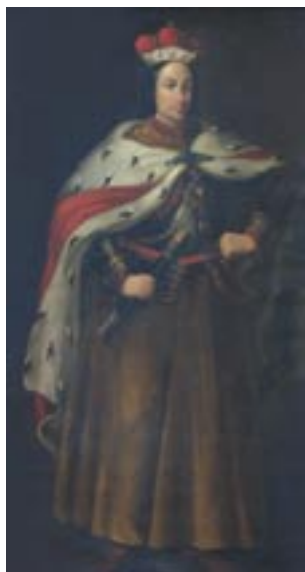
△ Didysis kunigaikštis Vytautas – vienas mylimiausių Lietuvos valdovų (paveikslas Kauno Arkikatedroje)

Pirmieji gyventojai Lietuvos teritorijoje pasirodė XI–IX tūkstantmečiais pr. m. e. Sėslūs gyventojai, žemdirbiai, baltų protėviai, Lietuvos teritorijoje pradėjo kurtis apie III tūkstantmetį pr. m. e. Senieji baltai augino avis ir ožkas, žiedė puodus, naudojo unikalią gynybinę piliakalnių sistemą. Baltai buvo žemdirbiai, auginantys javus ir sodus. Pirmieji auginti augalai – kviečiai, miežiai bei soros. Maistui naudojo žvėrių, galvijų mėsą, žvejojo, rinko miško gėrybes bei žoleles.