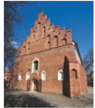
△ Šv. Mikalojaus bažnyčia – seniausias mūrinis kulto pastatas Lietuvoje

1708–1711 m. – didžiausias badas ir maras Lietuvos istorijoje: Žemaitijoje išmirė beveik pusė gyventojų.