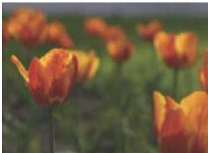
Vidutinė paros temperatūra +6^{\circ}\text{C} . Vidutinis mėnesio kritulių kiekis 33–50 mm