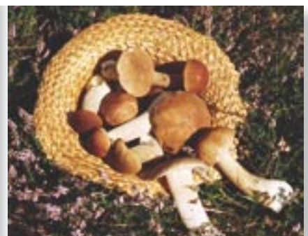
Vidutinė paros temperatūra +11,9°C. Vidutinis mėnesio kritulių kiekis 50–100 mm