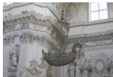
1569–1795 m. Baroko epocha LDK