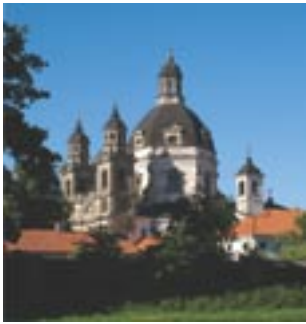
△ Pažaislio vienuolynas buvo uždarytas po 1863–1864 metų sukilimo prieš Rusijos valdžią

Po 1795 m. įvykusio trečiojo Abiejų Tautų Respublikos padalijimo didžiąją dabartinės Lietuvos dalį aneksavo Rusija.