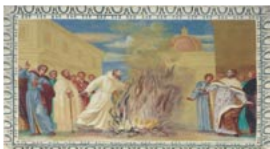
1009 m. Lietuvos vardas pirmą kartą paminėtas rašytiniuose šaltiniuose

Lietuva kaip valstybė susiformavo XIII a., jos įkūrėjas – vienintelis tikras Lietuvos karalius – Mindaugas, suvienijęs atskiras baltų gentis. Mindaugas buvo puikus karžygys bei politikas. Politinių tikslų genamas užkietėjęs pagonis pasikrikštijo, o 1253 m. liepos 6 d. Romos popiežiaus leidimu buvo karūnuotas Lietuvos karaliumi. Ši data yra laikoma Lietuvos Didžiosios Kunigaikštystės (LDK), taigi ir Lietuvos valstybės, įkūrimu. Po Mindaugo nužudymo (1258 m.) lietuviai vėl grįžo prie pagonybės, valstybė visam laikui prarado karūną. Valstybei stabilumą grąžino Mindaugo giminaitis Kernavės kunigaikštis Traidenis. Kadangi Mindaugo pilies vieta nėra tiksliai žinoma, Kernavė laikoma pirmąja Lietuvos sostine. XIII–XIV a. LDK išaugo į galingą karinę valstybę, nuo XIV a. II pusės iki XV a. pab. apėmusią visą pietvakarinę Rytų Europos dalį.