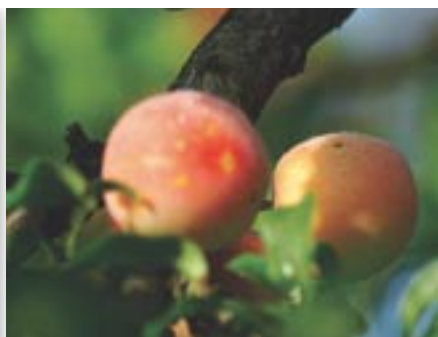
Vidutinė paros temperatūra +16,2°C. Vidutinis mėnesio kritulių kiekis 70–80 mm