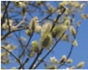
△ Pavasarį pranašauja „kačiukai“