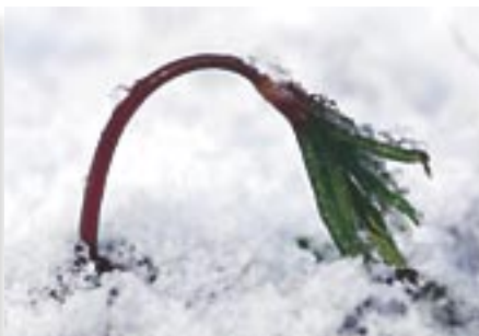
Vidutinė paros temperatūra -4,5°C. Vidutinis mėnesio kritulių kiekis 20–50 mm