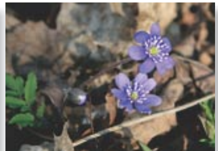
Vidutinė paros temperatūra -0,7°C. Vidutinis mėnesio kritulių kiekis 30–40 mm