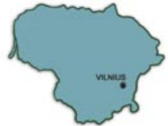
△ Vieniems Lietuva savo forma panaši į žmogaus veido profilį, kitiems – į širdį

Šiuo metu naudojama Lietuvos tautinė vėliava oficialiai pradėta naudoti tik prieškarinio nepriklausomybės metais, sovietų okupacijos metu buvo uždrausta ir vėl pripažinta 1989 m. kovo 20 d. Daugelį amžių Lietuvos valstybėje buvo naudojama vienspalvė purpurinė vėliava su herbu vėliavos viduryje. Lietuvos tautinę vėliavą, vadinamą Trispalve, sudaro geltonos, žalios ir raudonos spalvos vienodo pločio audeklo juostos.