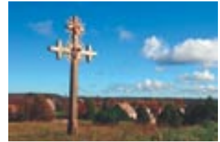
△ Žemaitija buvo apkrikštyta vėliausiai (1413–1417); kryžius Žemaitijos nacionaliniame parke