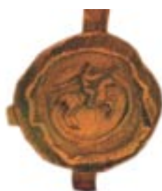
1253 m. liepos 6 dieną karūnuotas Mindaugas – vienintelis Lietuvos karalius