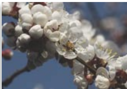
Vidutinė paros temperatūra +13^{\circ}\text{C} . Vidutinis mėnesio kritulių kiekis 40–70 mm