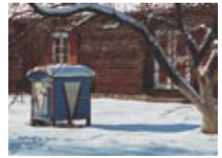
△ Žiema Lietuvos liaudies buities muziejuje (Rumšiškės, Kaišiadorių r.)

Nors žiema Lietuvoje palyginti švelni, tačiau kiekvieną žiemą būna bent keletas dienų, kai termometrų stulpeliai nukrenta žemiau -25^{\circ}\text{C} , dėl tokių oro išdaigų beveik kiekvienais metais nukenčia egzotinių augalų augintojai. Sniego tai yra, tai nėra, todėl rogutėmis paprastai važinėjamasi sausio–vasario mėnesiais, nors nuolatinė sniego danga dažnai laikosi iki kovo vidurio. Sniego storis paprastai siekia 25–35 cm, tik pamario krašte sniego sluoksnis visuomet būna plonesnis. Žiemą dažnai rytais kelius nukloja plikšala, dėl sniego sluoksnio keliai tampa slidūs arba sunkiai pravažiuojami, todėl vairavimo sąlygos žiemą būna sudėtingos. Nuo lapkričio 10 iki balandžio 1 dienos automobiliais galima važinėti tik su žieminėmis padangomis.