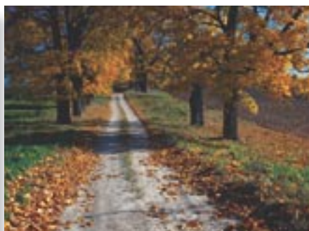
Vidutinė paros temperatūra -3^{\circ}\text{C} . Vidutinis mėnesio kritulių kiekis 40–95 mm