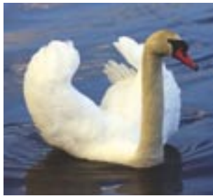
△ Gulbės dažnai lieka žiemoti Lietuvoje

Lietuvos klimatas – pereinantis iš jūrinio į žemyninį, drėgnas tiek žiemą, tiek ir vasarą. Didžiausią įtaką Lietuvos klimatui daro Atlanto vandenynas bei Golfo srovė. Orai Lietuvoje permainingi visais metų laikais. Vidutinė metinė temperatūra šalyje yra 6,2 °C. Skirtumas tarp šilčiausio (liepos) ir šalčiausio (sausio) mėnesių statistiškai siekia 21,8 °C.