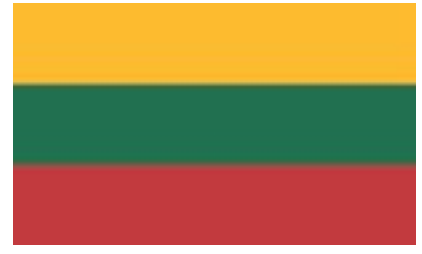
△ Lietuvos Respublikos vėliava

Lietuvos Respublika yra Baltijos regiono šalis, esanti geografiniame Europos centre, pietrytinėje Baltijos jūros pakrantėje. Lietuva jūra bei sausuma ribojasi su Latvija, kuri taip pat priklauso Baltijos šalių regionui, Lenkija, Baltarusija, Rusijai priklausančia Kaliningrado sritimi. Nors Lietuva yra jūrinė valstybė, ji valdo tik 90 km Baltijos jūros pakrantės. Bendras šalies plotas – 65 200 kv. km, tad pagal savo dydį Lietuva tarp 191 pasaulio valstybės užima 120 vietą: už mūsų šalį mažesnės yra Baltijos regiono šalys Latvija ir Estija, taip pat Danija, Belgija, Slovėnija ir kt.