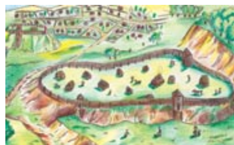
Kernavė tapo pirmąja žinoma Lietuvos sostine