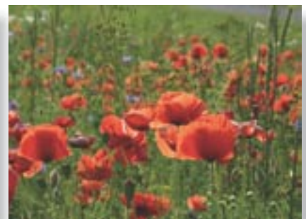
Vidutinė paros temperatūra +15^{\circ}\text{C} . Vidutinis mėnesio kritulių kiekis 45–80 mm