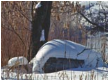
Vidutinė paros temperatūra -5°C. Vidutinis mėnesio kritulių kiekis 25–70 mm