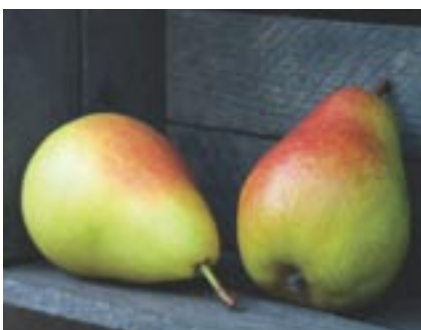
Vidutinė paros temperatūra +7^{\circ}\text{C} . Vidutinis mėnesio kritulių kiekis 40–70 mm